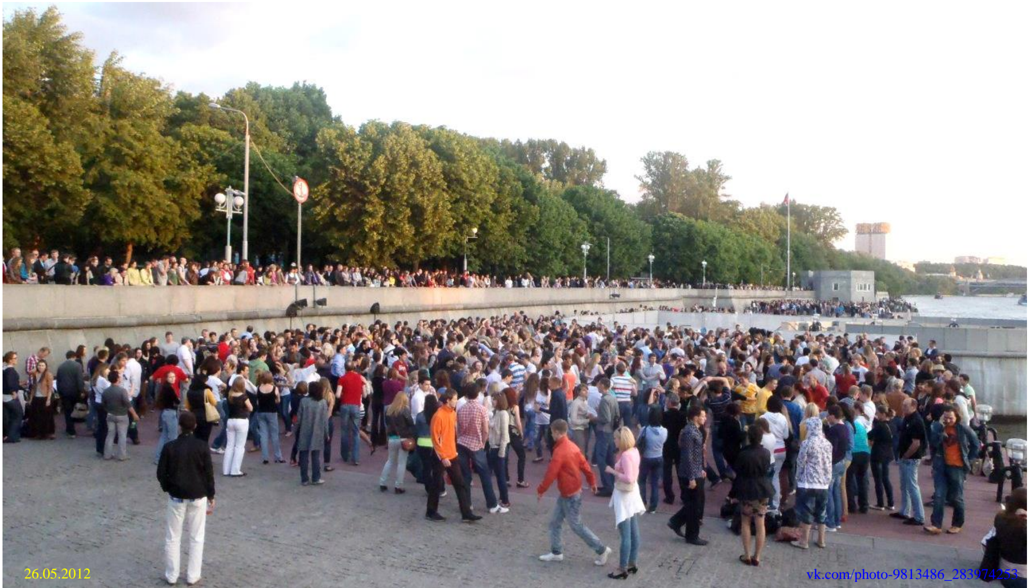
Вид на три танцплощадки Пушкинской набережной (в не самое пиковое время) со стороны моста, май 2012 года.

Тысячи благодарностей, сотни новых знакомств, десятки новых семей.